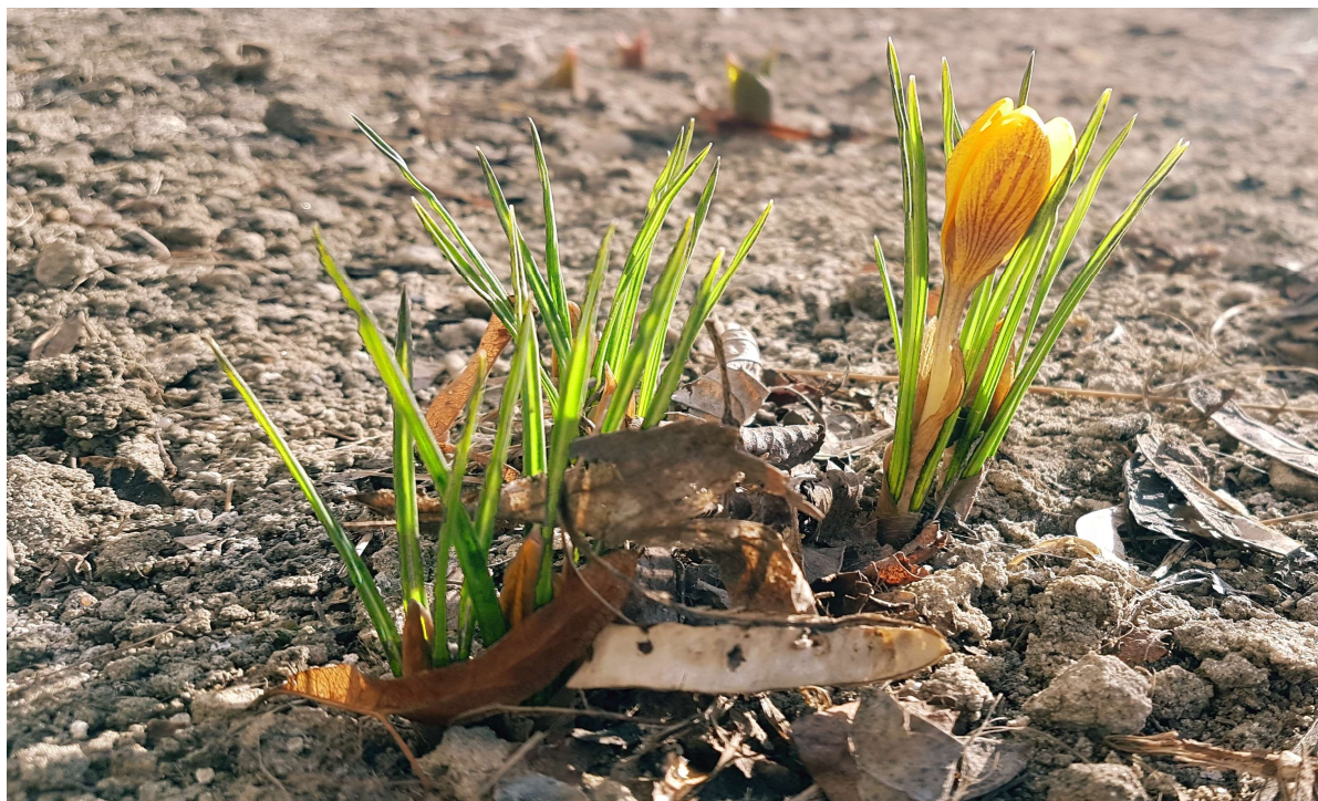
Praca konkursowa klasa 3e „Wiosna”